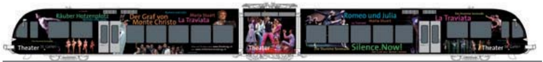
34 010 : SBB Pendelzug GTW 2/6 Turbo «Theater St. Gallen»