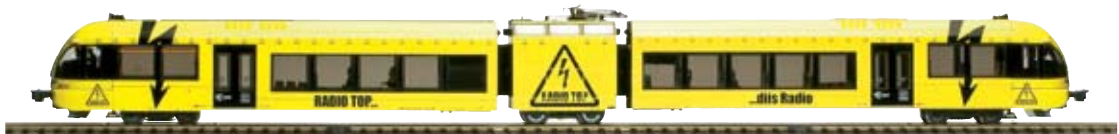
34 009 : SBB Pendelzug GTW 2/6 Turbo «Top-Blitz»