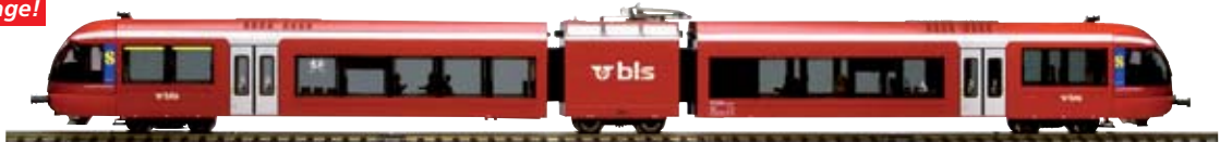
34 008 : BLS Pendelzug GTW 2/6, rot, Nr. 526 265-4, Wankdorf