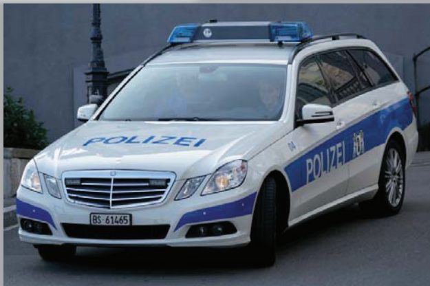
MB E350 T-Klasse „Polizei Basel-Stadt“ Masstab: 1:87 (03/2012)

Die Kantonspolizei in der Stadt Basel benutzt für Ihre Einsätze den Mercedes Benz T-Klasse mit spezieller Bemalung in weiss und blau mit aufgedrucktem Stadtwappen der Stadt Basel.