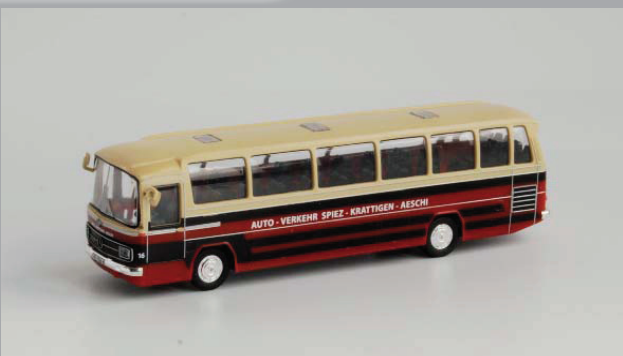
MB O302 „Verkehrsbetriebe Spiez“ Masstab: 1:87