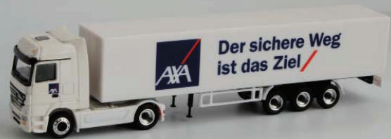
MB Actros „AXA Versicherung Schweiz“ Masstab: 1:87