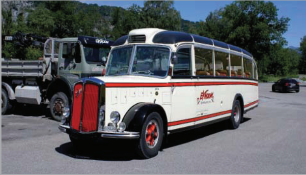
Saurer 4LC „Evasion“ Masstab: 1:87