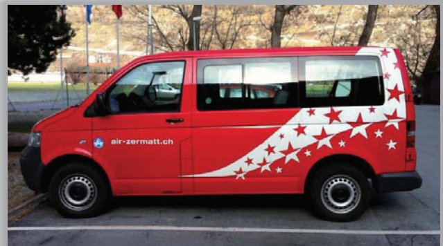
VW Bus T5 „Air Zermatt“ Masstab: 1:87 (09/2012)

Seit diesem Jahr werden Rettungseinsätze nicht nur von der REGA oder der Air Zermatt geflogen, sondern auch vom TCS.