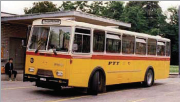
FBW 50U Reisepostwagen Masstab: 1:87