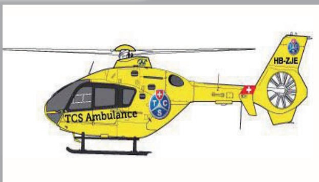
Helikopter EC-135 „TCS Ambulance“ Masstab: 1:87 (09/2012)