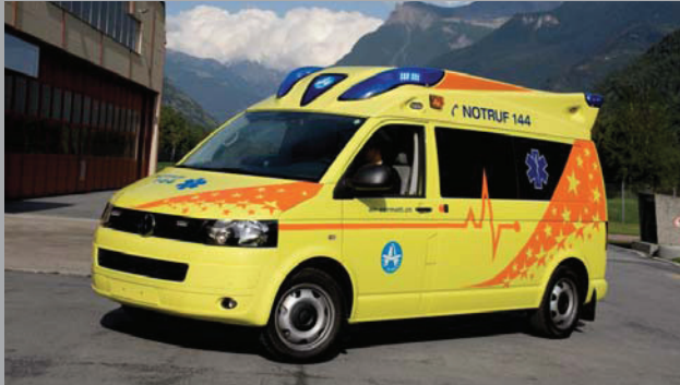
VW Crafter Ambulanz „Air Zermatt“ Masstab: 1:87 (09/2012)

Für den Transport Verletzter werden bei der Air Zermatt nicht nur Helikopter eingesetzt, sondern auch seit neuester Zeit auch Ambulanzfahrzeuge vom Typ VW Crafter.