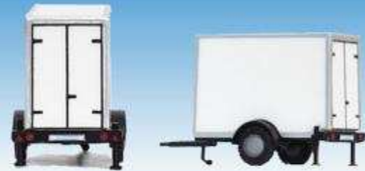
neutral, weiss 08700402