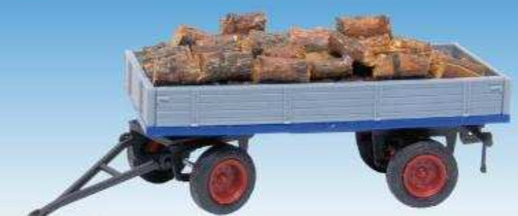
Pritschenwagen mit Brennholzladung 08700624