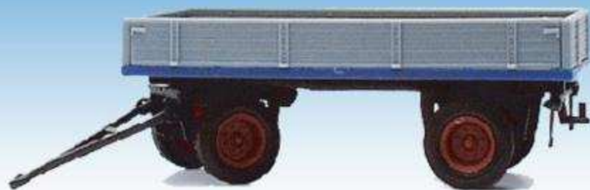
Pritschenwagen, niedrige Bordwände 08700614