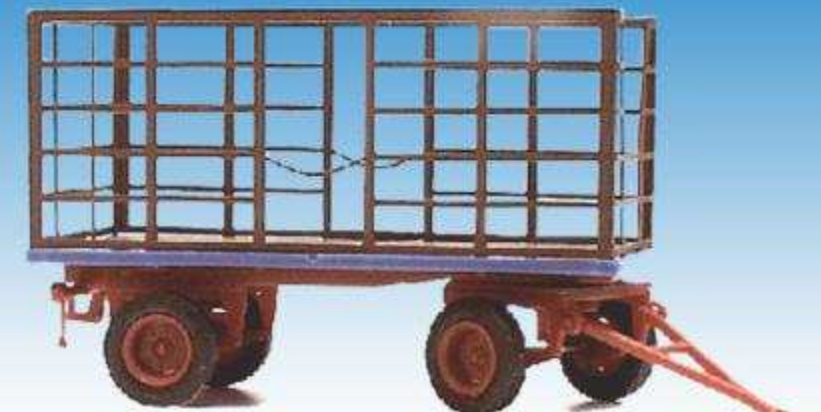
Heuwagen mit Metallaufbau 08700612