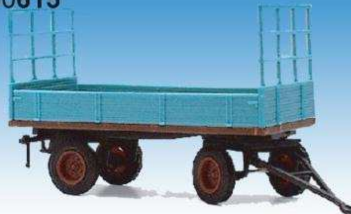
Alter Strohanhänger mit Bordwänden 08700615