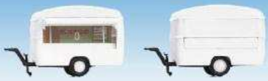
Bausatz, weiss (ein Modell) 08700105