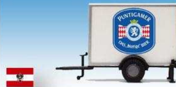
"Puntigamer Bier" 08700416