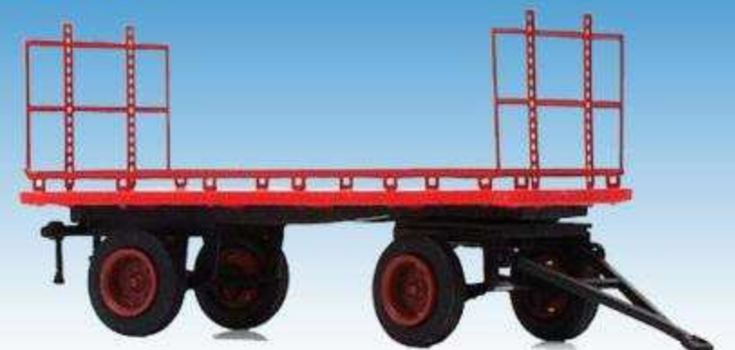
Mehrzweckanhänger mit Metallaufbau 08700619