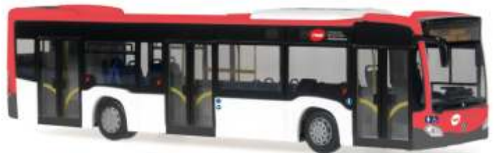
MERCEDES-BENZ Citaro ´12 „Barcelona“ 69444 | 1:87 | ES | PG 45