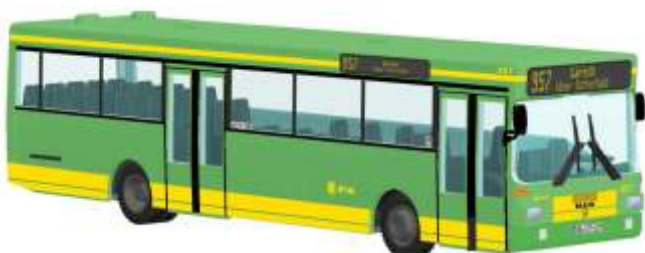
MAN SL 202 „Stoag, Oberhausen“ 72121 | 1:87 | D | PG 45