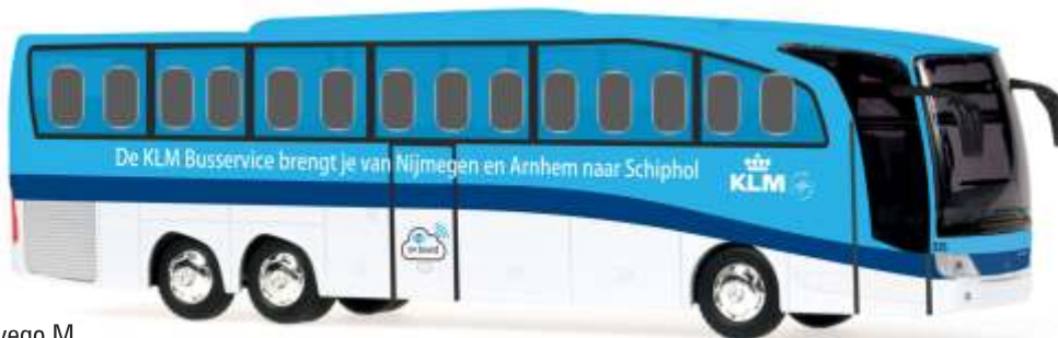
MERCEDES-BENZ Travego M „KLM“ 14123 | 1:43 | NL | PG 59