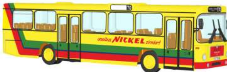
MAN SL 200 „Nickel Reisen, Zirndorf“ 72311 | 1:87 | D | PG 49