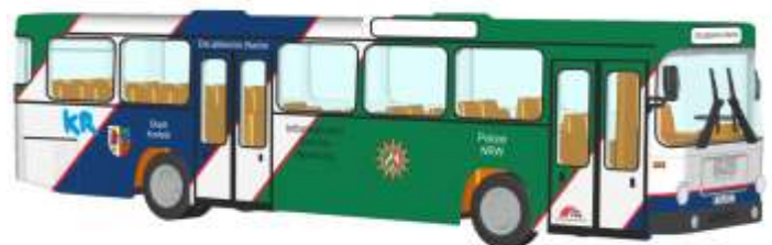
MAN SL 200 „Polizei NRW“ 72306 | 1:87 | D | PG 49