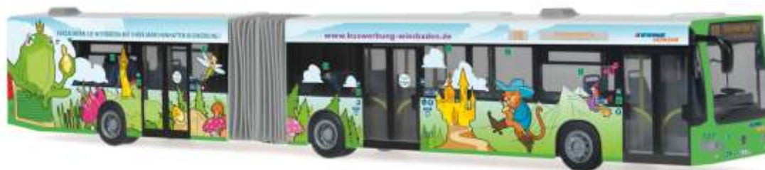
MERCEDES-BENZ Citaro G `06 „ESWE - Märchenbus“ 67083 | 1:87 | D | PG 50