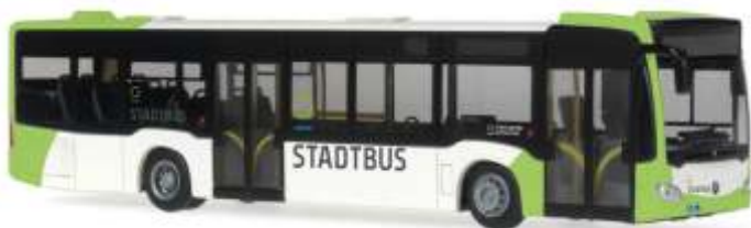
MERCEDES-BENZ Citaro `11 „Stadtwerke Gütersloh“ 68729 | 1:87 | D | PG 45