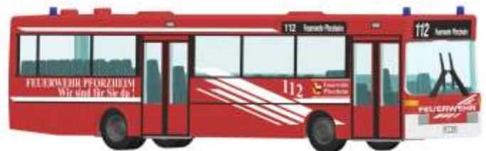
MERCEDES-BENZ O 405 „Feuerwehr Pforzheim“ 71822 | 1:87 | D | PG 45