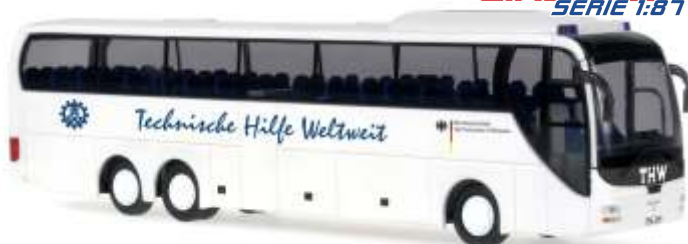
MAN Lion's Coach „THW- Technisches Hilfswerk“ 65540 | 1:87 | D | BOX | PG 43