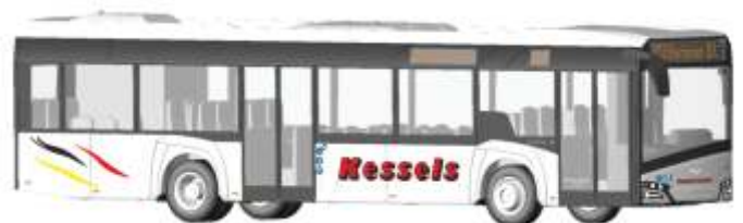
SOLARIS Urbino 12 `14 „Kessels Reisen, Brüggen“ 73002 | 1:87 | D | PG 46