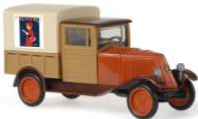
RENAULT NN „Freixenet“ 83067 | 1:87 | ES | PG 21