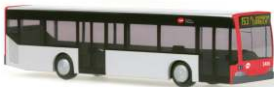
MERCEDES-BENZ Citaro „Barcelona“ 16969 | 1:160 | ES | PG 27