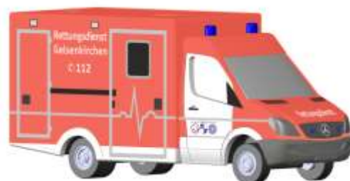
WAS RTW „Rettungsdienst Gelsenkirchen“ 16182 | 1:160 | D | PG 25