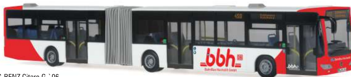
MERCEDES-BENZ Citaro G `06 „BBH - Bahn Bus Hochstift“ 67084 | 1:87 | D | PG 50