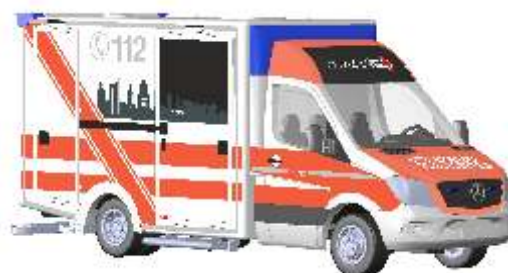
WIETMARSCHER AMBULANZF. Design-RTW 2012 „DRK Leipzig“ 72020 | 1:87 | D | PG 28