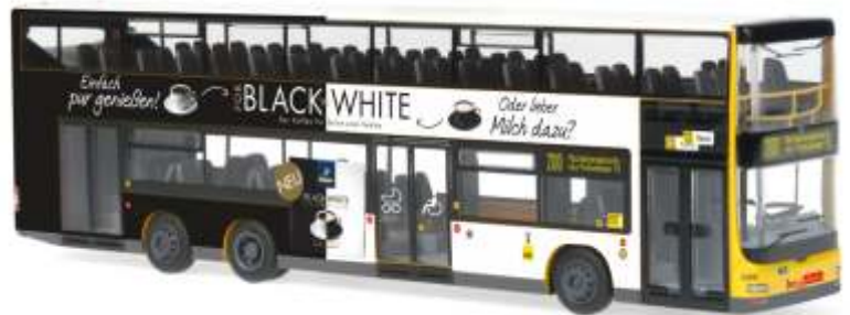
MAN Lion's City DL07 „BVG - Tchibo“ 67771 | 1:87 | D | PG 49