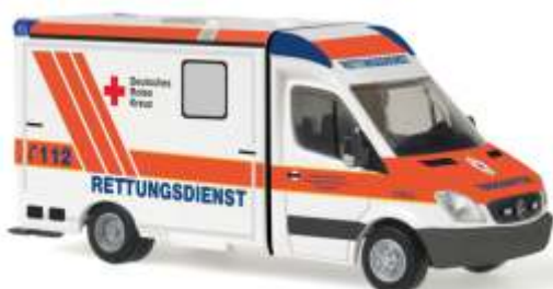
STROBEL RTW „DRK Karlsruhe“ 61793 | 1:87 | D | PG 28