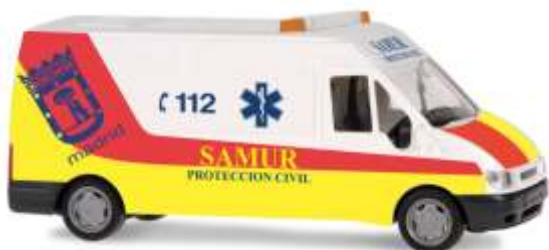
FORD Transit 2000 „Proteccion Civil Samur“ 51062 | 1:87 | ES | PG 19