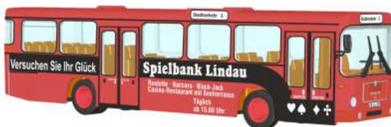
MAN SL 200 „RBA - Spielbank Lindau“ 72312 | 1:87 | D | PG 49