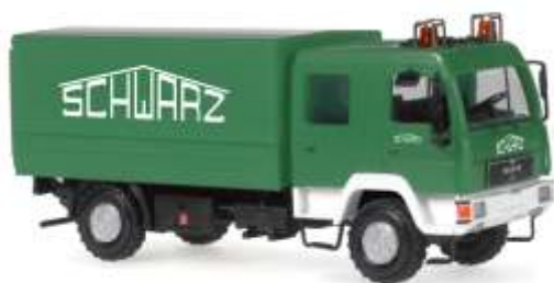
MAN L2000 DoKa „Schwarzbau“ 68038 | 1:87 | D | PG 34