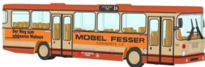
MAN SL 200 „Stadtwerke Trier“ 72310 | 1:87 | D | PG 49