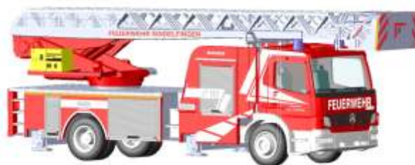
MAGIRUS Atego DLK 32 „Feuerwehr Sindelfingen“ 71612 | 1:87 | D | PG 45