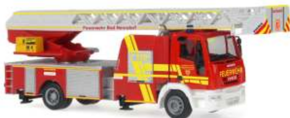
MAGIRUS DLK 32 „Feuerwehr Bad Nenndorf“ 68557 | 1:87 | D | PG 45