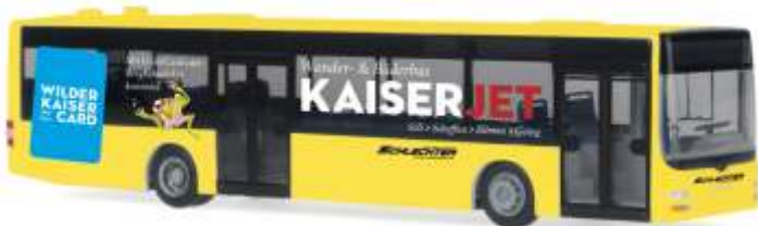
MAN Lion's City „Autobus Schlechter - Kaiser Jet“ 67493 | 1:87 | AT | PG 45