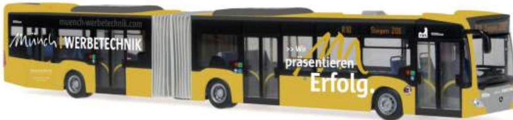
MERCEDES-BENZ Citaro G ´12 „VWS Siegen - Münch Werbetechnik“ 69539 | 1:87 | D | PG 49