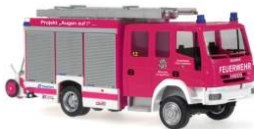
MAGIRUS Alufire 3 HLF 20 „Feuerwehr Erkrath“ 68303 | 1:87 | D | PG 43