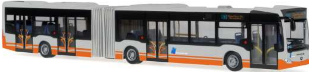
MERCEDES-BENZ Citaro G ´12 „STIB“ 69537 | 1:87 | BE | PG 49