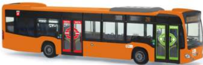
MERCEDES-BENZ Citaro ´12 „CTT - Livorno“ 69445 | 1:87 | IT | PG 45