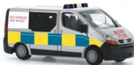
OPEL Vivaro „Military Police“ 51327 | 1:87 | GB | PG 19