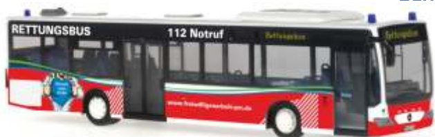
MERCEDES-BENZ Citaro Ü `06 „Rettungsbus Feuerwehr Potsdam“ 66993 | 1:87 | D | BOX | PG 45