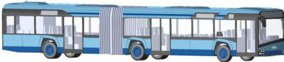
SOLARIS Urbino 18 `14 „Stadtwerke Passau“ 73102 | 1:87 | D | PG 49