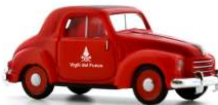
FIAT Topolino „Vigili del Vuoco“ 83106 | 1:87 | IT | PG 21