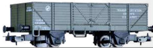
Offener Güterwagen der USTC Open car of the USTC