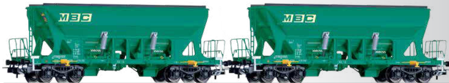
Güterwagenset der MBC, bestehend aus zwei Selbstentladewagen Faccns Freight car set of the MBC with two hopper cars Faccns