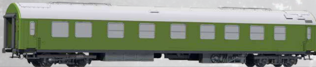
Salonwagen B mit Küche, ursprüngliche Nummer 60 50 89-40 009-3