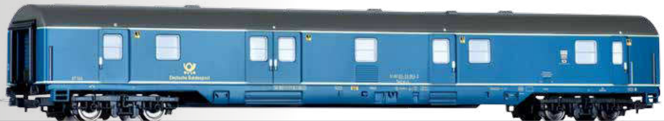
ÜBERARBEITUNG: Bahnpostwagen Post mr-a/26 der Deutschen Bundespost NEW: Mail wagon Post mr-a/26 of the Deutschen Bundespost