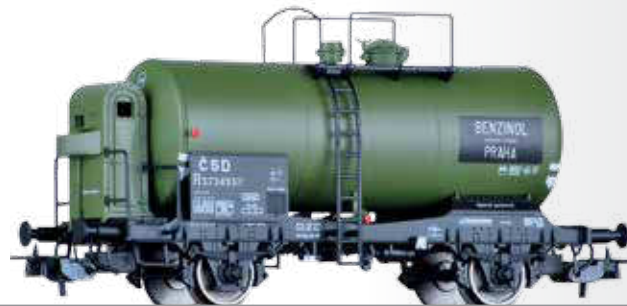
Kesselwagen R „BENZINOL“ der ČSD Tank car R „BENZINOL“ of the ČSD