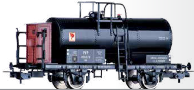
Kesselwagen Rh der PKP Tank car Rh of the PKP