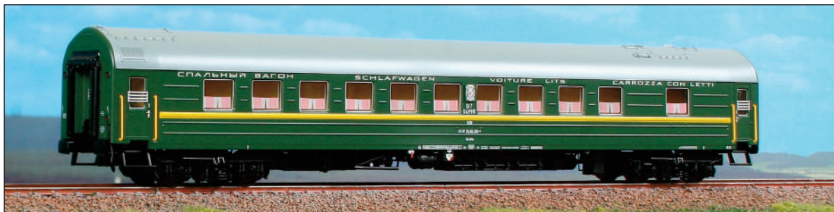
Carrozza letti delle ferrovie sovietiche SZD con finestrini d'origine, in livrea verde. Russian sleeping car with original windows and green livery. Schlafwagen der RZD, mit original Fenstern, grüne Lackierung