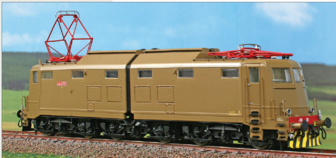
Locomotiva E 636.123 del deposito di Trieste, in livrea Isabella. Electric locomotive E.636.123, assigned at Trieste Depot, full light brown livery. E-Lok E.636.123, Bw Trieste, in "Isabella" Lackierung.