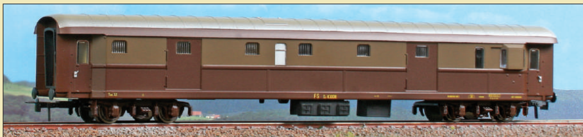
Bagagliaio FS Tipo 1946 (Dz 83000) in livrea castano e Isabella, carrelli FS AM. Type 1946 luggage car (Dz 83000) of the FS, two tone brown livery, Type FS AM bogies. Typ 1946 Gepäckwagen der FS (DUz 83000), castano-Isabella Lackierung, Typ FS AM Drehgestelle