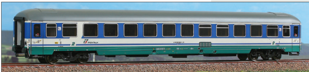
Carrozza UIC-X di 2ª classe Tipo 2000R "Giubileo" in livrea XMPR con logo "Trenitalia" rosso/verde e tetto liscio. Type UIC-X 2000R "Giubileo" 2 nd class car, XMPR livery with smooth roof. Typ UIC-X 2000R "Giubileo" Wagen 2.Kl. der Trenitalia, XMPR Lackierung mit glattes Dach.