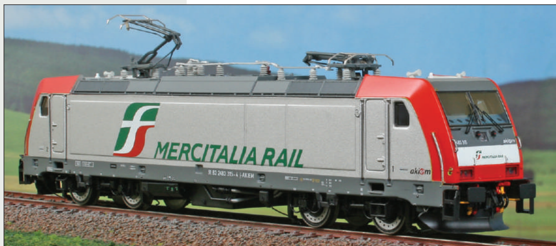
Locomotiva 483 315 noleggiata all'Impresa ferroviaria Mercitalia Rail (Gruppo FS). Electric locomotive 483 315 hired to the railway Company Mercitalia Rail. Elektrolokomotive 483 315 vermietet an das Bahnunternehmen Mercitalia Rail.