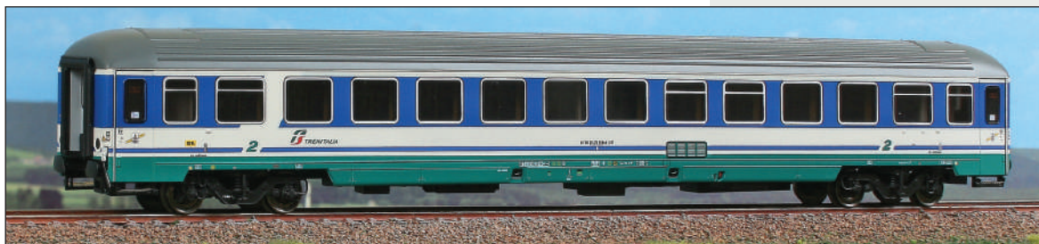
Carrozza UIC-X di 2ª classe Tipo 2000R "Giubileo" in livrea XMPR con logo "Trenitalia" rosso/verde e tetto cannellato. Type UIC-X 2000R "Giubileo" 2 nd class car, XMPR livery with ribbed roof. Typ UIC-X 2000R "Giubileo" Wagen 2.Kl. der Trenitalia, XMPR Lackierung mit gewelt Dach.