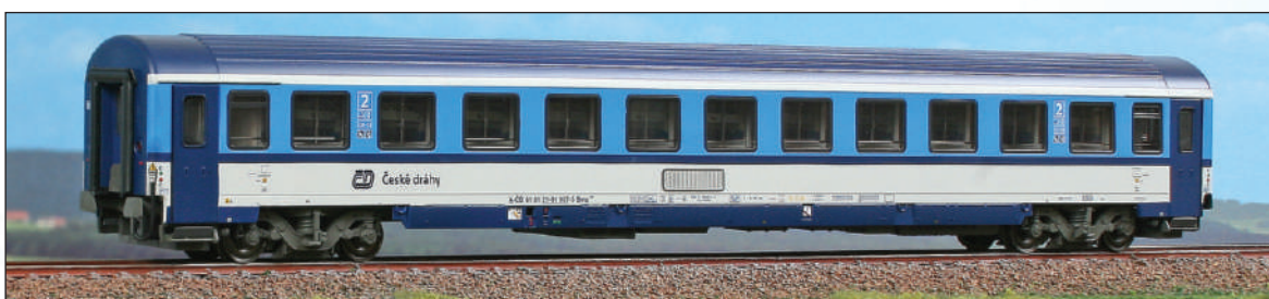
Carrozza di 2 a classe Bmz 235 delle Ferrovie Ceche in livrea "Najbrt" con cornici dei finestrini in nero (ex ÖBB). 2nd Class car Bmz 235 of the Czech Railways, in "Najbrt" livery, with black windows frame (former ÖBB). 2. Klasse Abteilwagen Bmz 235 der Tscheche Eisenbahnen, in "Najbrt" Lackierung. (ex ÖBB).