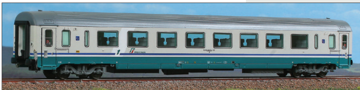
Carrozza Gran Confort di 1ª classe Tipo 1985 a salone in livrea XMPR con fiancate risanate. Type GC 1 st class car, IC XMPR livery with refurbished sides. Typ GC Wagen 1.Kl. der Trenitalia, IC XMPR Lackierung.