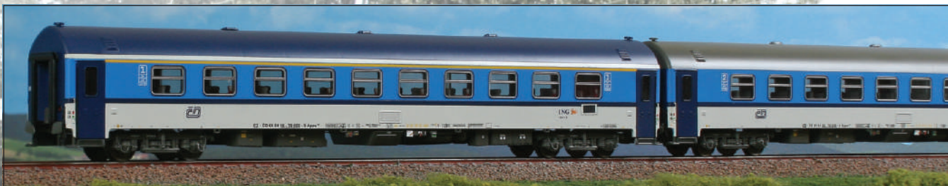
Set di due carrozze delle Ferrovie Ceche in livrea "Najbrt", una di 1 a classe Apee 139 e una di 2 a classe Bpee 237 Set of two Czech Railways cars, 1 st class Apee 139 and 2 nd class Bpee 237 in "Najbrt" livery. Set aus zwei Tscheche Eisenbahnen Wagen in "Najbrt" Lackierung. Einem 1. Kl. Apee 139 und einem 2. Kl.