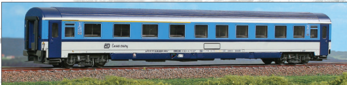
Carrozza di 1 a e 2 a classe ABmz 235 delle Ferrovie Ceche in livrea "Najbrt" con cornici dei finestrini in azzurro (ex ÖBB). 1 st /2 nd cl. car ABmz 235 of the Czech Railways, in "Najbrt" livery, with light blue windows frame (former ÖBB). 1./2. Klasse Abteilwagen ABmz 235 der Tscheche Eisenbahnen, in "Najbrt" Lackierung. (ex ÖBB).