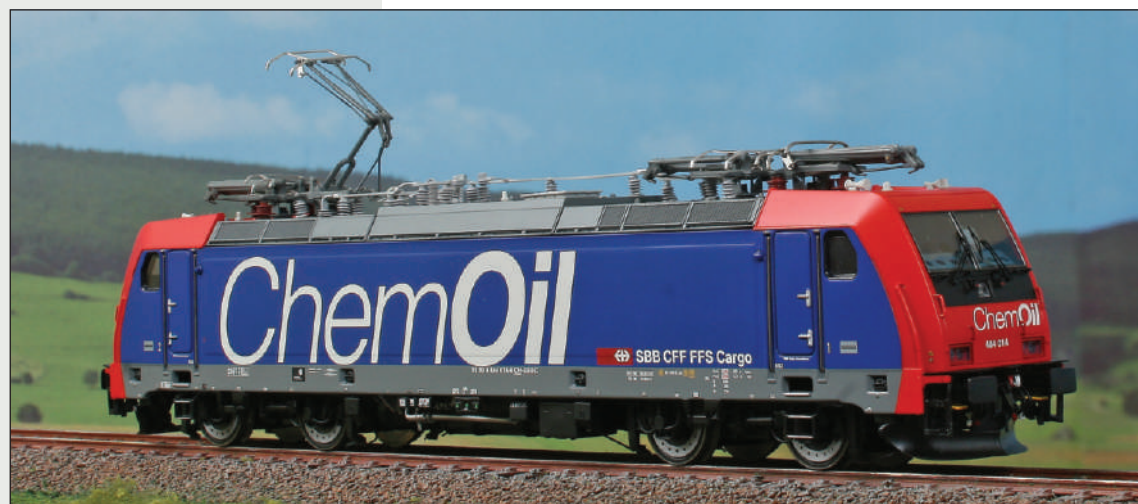
Locomotiva 484 014 dell'Impresa ferroviaria SBB Cargo con iscrizioni "ChemOil". Electric locomotive 484 014 of the railway Company SBB Cargo, with "ChemOil" inscriptions. Elektrolokomotive 484 014 der Bahnunternehmen SBB Cargo in "ChemOil" Lackierung.