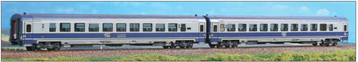
Set de două vagoane de clasa a doua de Tipul AVA 200 pentru trafic intern și extern aparținând Căilor Ferate Române. Versiunea gri. Set of two 2nd class coaches, Type AVA 200, for internal and international service of the CFR (Rumenian Railways). Gray livery.